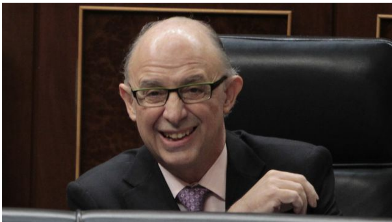
El ministro de Hacienda, Cristóbal Montoro.